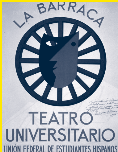
CARTEL ORIGINAL DE LA BARRACA

Plaza de la Parroquia de San Pedro ad Vincula (Villa de Vallecas)