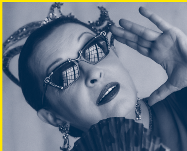
SANTIAGO AUZERÓN CARMELO GÓMEZ / MARTIRIO