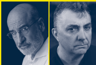
FERNANDO ARAMBURU / MANUEL VILAS

19.30 h Entrada libre hasta completar aforo Actividad con interpretación en LSE