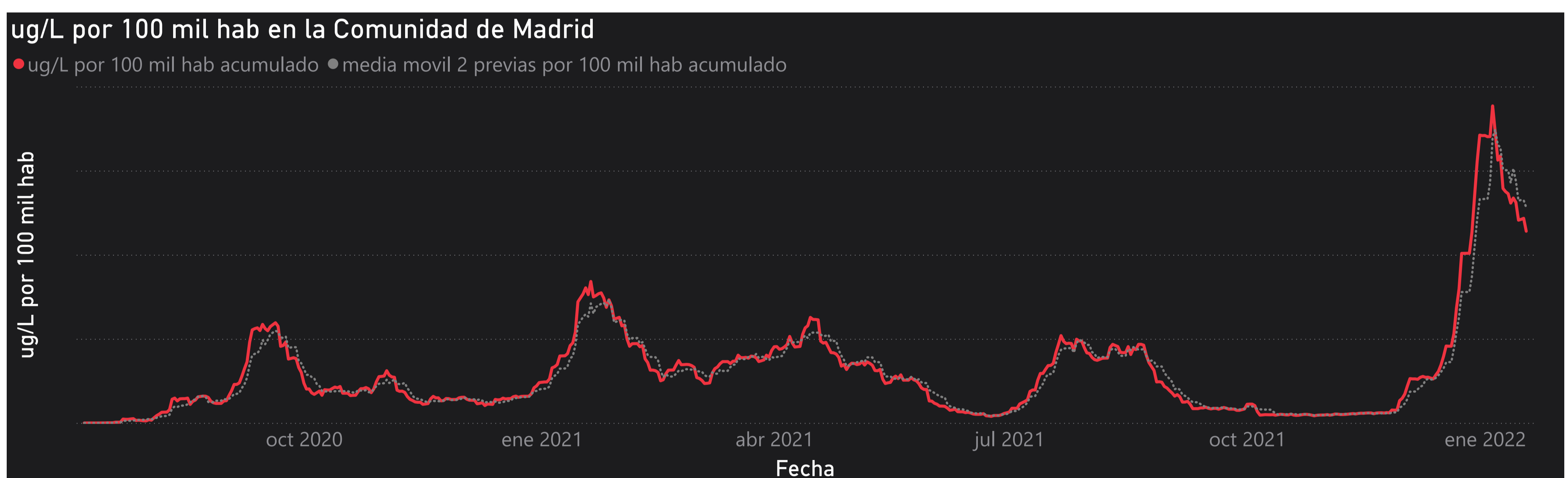
Gráfico 1. Evolución general de la Comunidad de Madrid

*En periodos de lluvia los resultados en el agua residual pueden verse afectados por la dilución de las aguas.