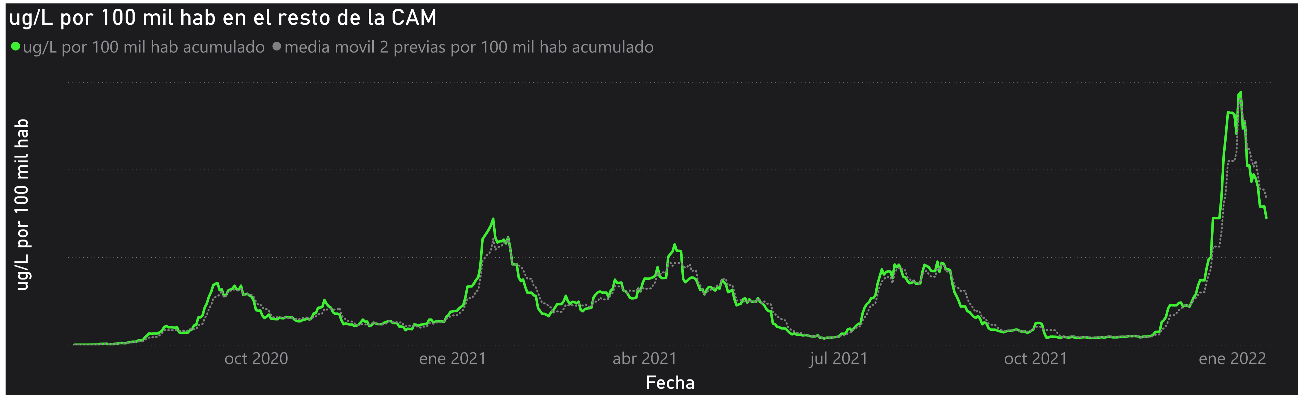
Gráfico 3. Evolución general de la Comunidad de Madrid, excluyendo la capital