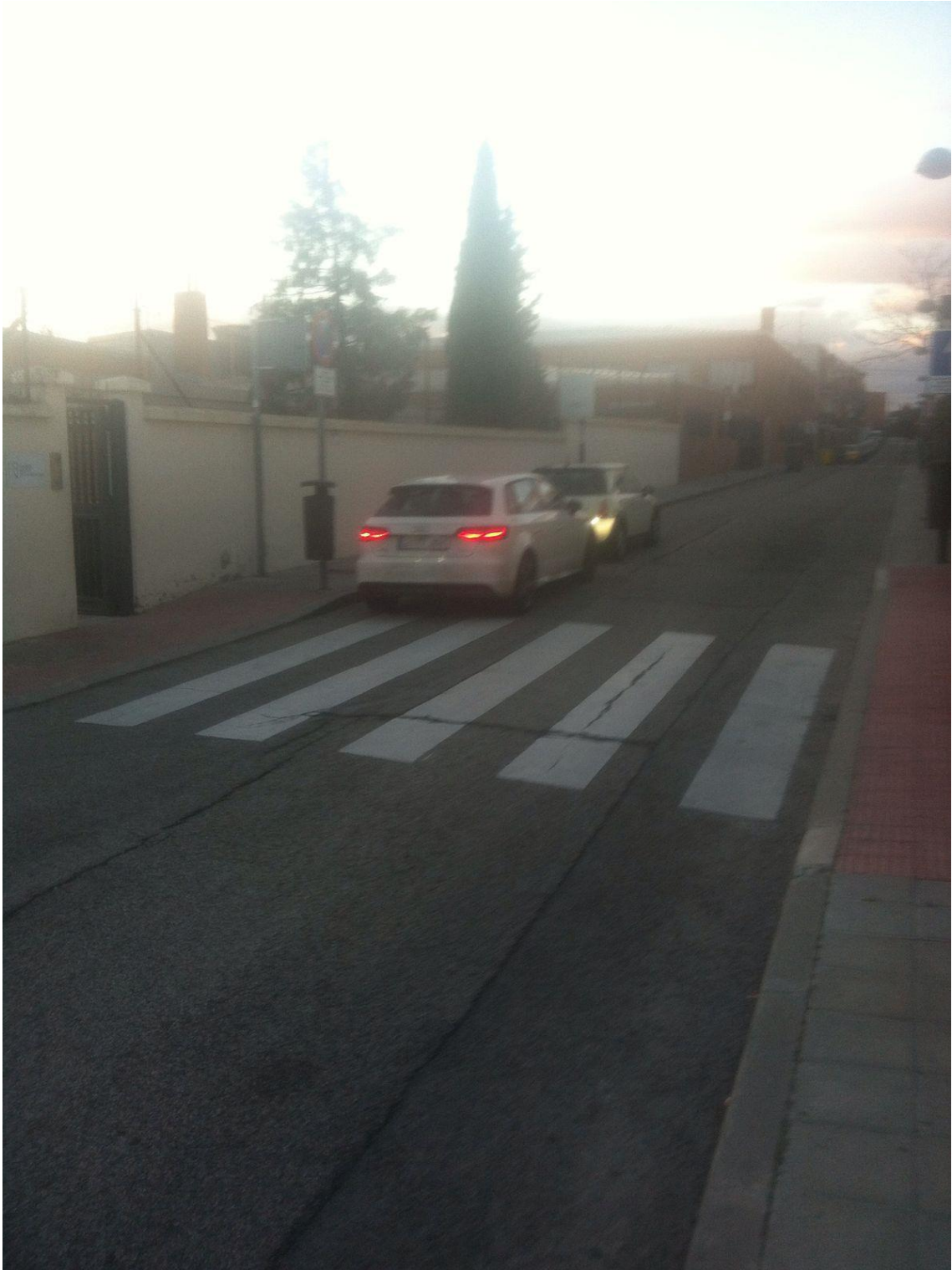
Día 13 de enero 18.15hs