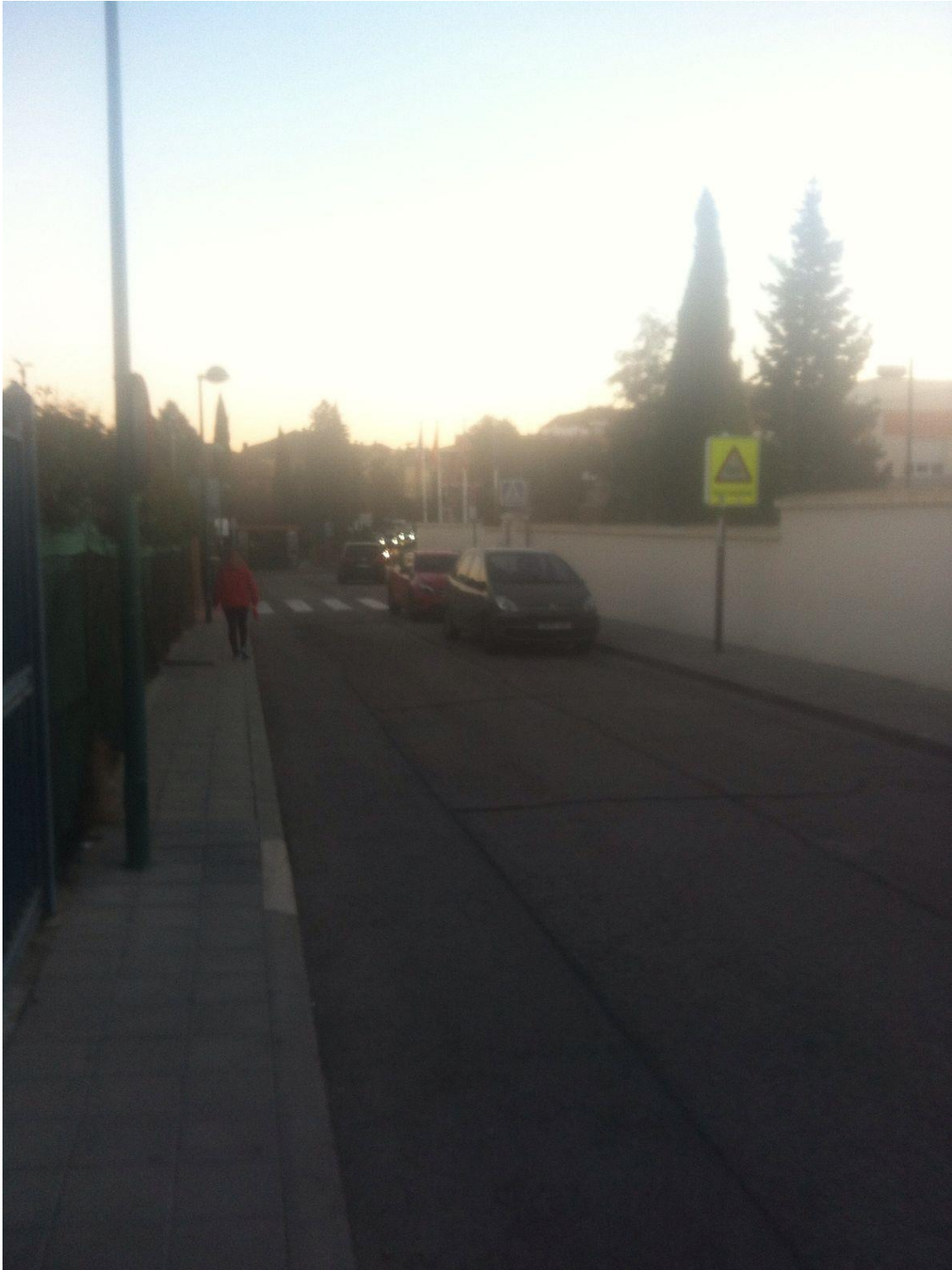
Día 9 de enero 18:00hs